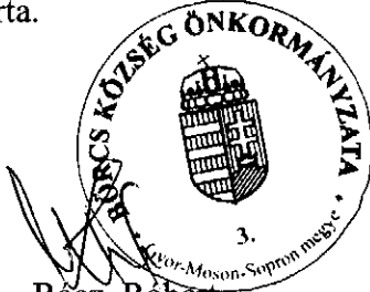
Rác Róbert polgármester

Rác Róbert polgármester úr, mivel kérdés, hozzászólás, javaslat egyéb napirendi pontra nem volt megköszönte a megjelentést, majd a képviselő-testületi ülés 20 óra 10 perckor bezárta.